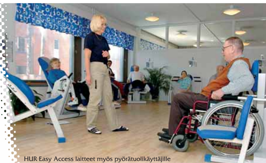
HUR Easy Access laitteet myös pyörätuolikäyttäjille