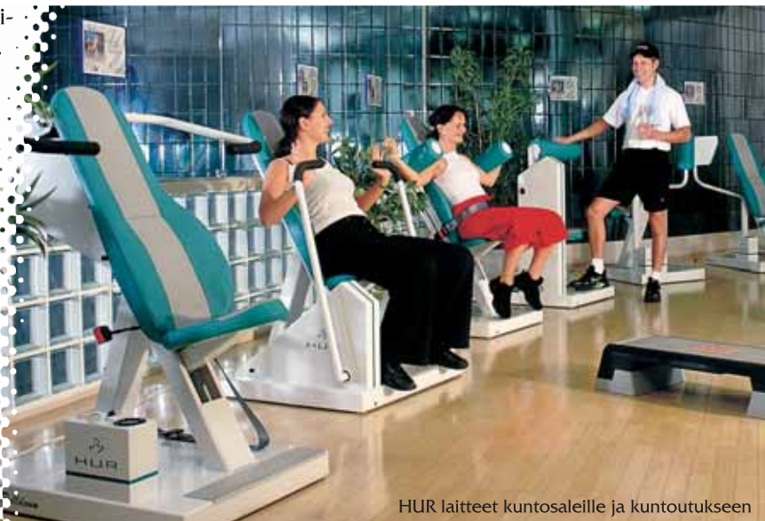
HUR laitteet kuntosaleille ja kuntoutukseen