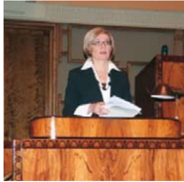
Ministeri Paula Risikko avasi seminaarin

F ysioterapian tulevaisuus osana sosiaali- ja terveydenhuollon sekä kuntoutuksen palvelujärjestelmää oli tarkastelussa Kuntaliiton, Suomen Fysioterapia- ja kuntoutusyritykset FYSI ry:n ja Suomen Fysioterapeutit ry:n Kuntatalolla järjestämässä Fysioterapia vahvaksi, laatu näkyväksi –seminaarissa. Koolla oli 80 eri toimialoilla ja eri tehtävissä työskentelevää fysioterapeuttia eri puolilta maata.