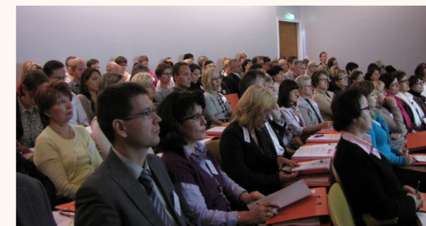
Viime vuoden FYSI -yrittäjpäivillä oli tiivis tunnelma. - Erinomainen ja tarpeellinen tietojen päivitys, oli osallistujien yleisin kommentti.